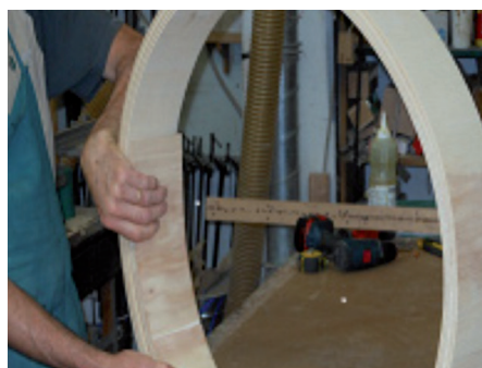
Esempio di spalla T Flex ricurva

Attenzione: sul sito www.posaclima.it alla sezione "Prodotti" è possibile scaricare la scheda tecnica del prodotto, i filmati dimostrativi ed eventuali certificazioni di prodotto