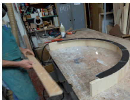
Esempio di costruzione controllelaio con curvatura superiore (profilo T Flex + battuta Profile)